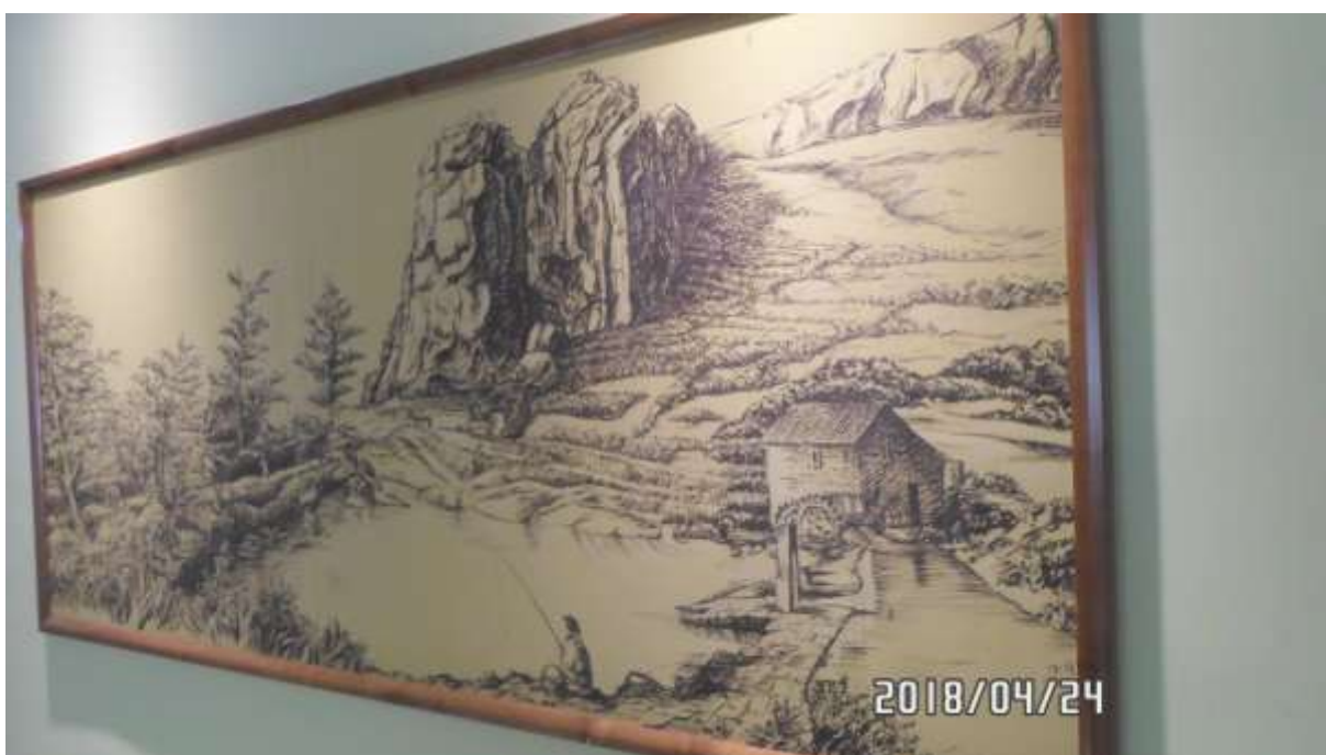
Istarske toplice, stara slika