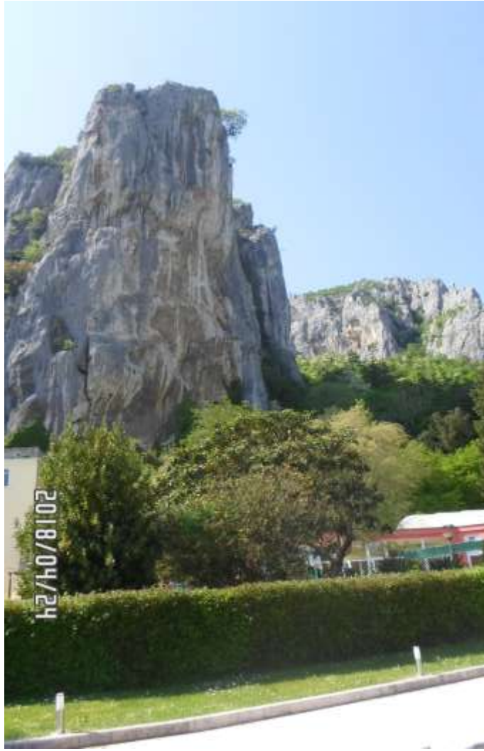
Istarske toplice, stijena iznad izvora