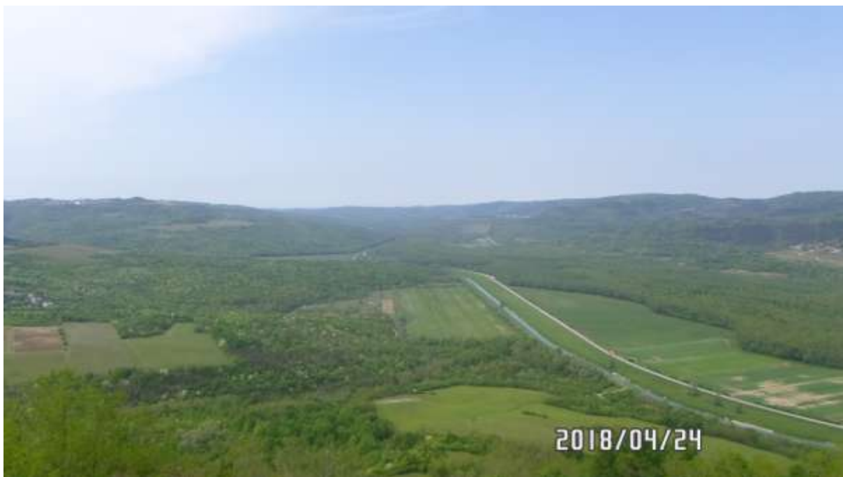
Motovun, pogled na dolinu Mirne