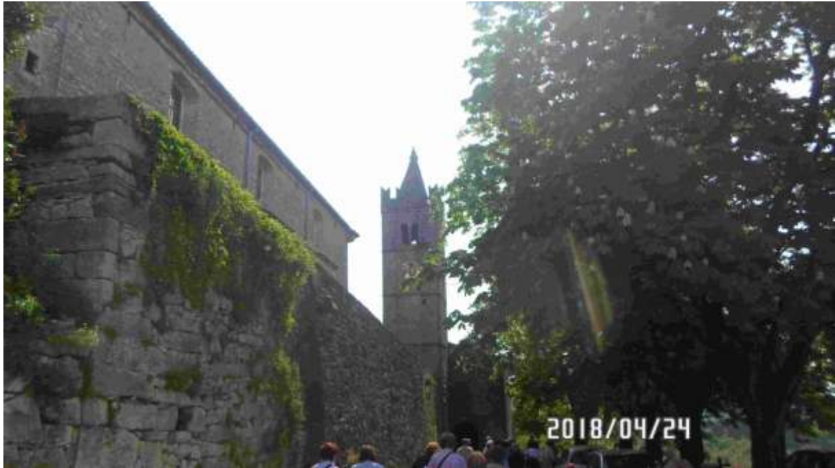
Hum, ulaz u "grad"

Istarske toplice: Lijepi objekt, ugodan ručak