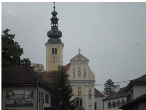
Crkva u Lepoglavi