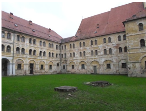
Pavlinski samostan u Lepoglavi