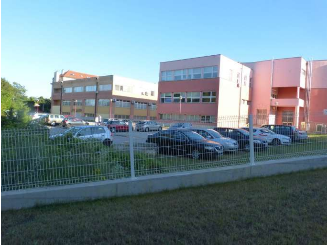
Pogled na Sveučilište DI južno od doma.