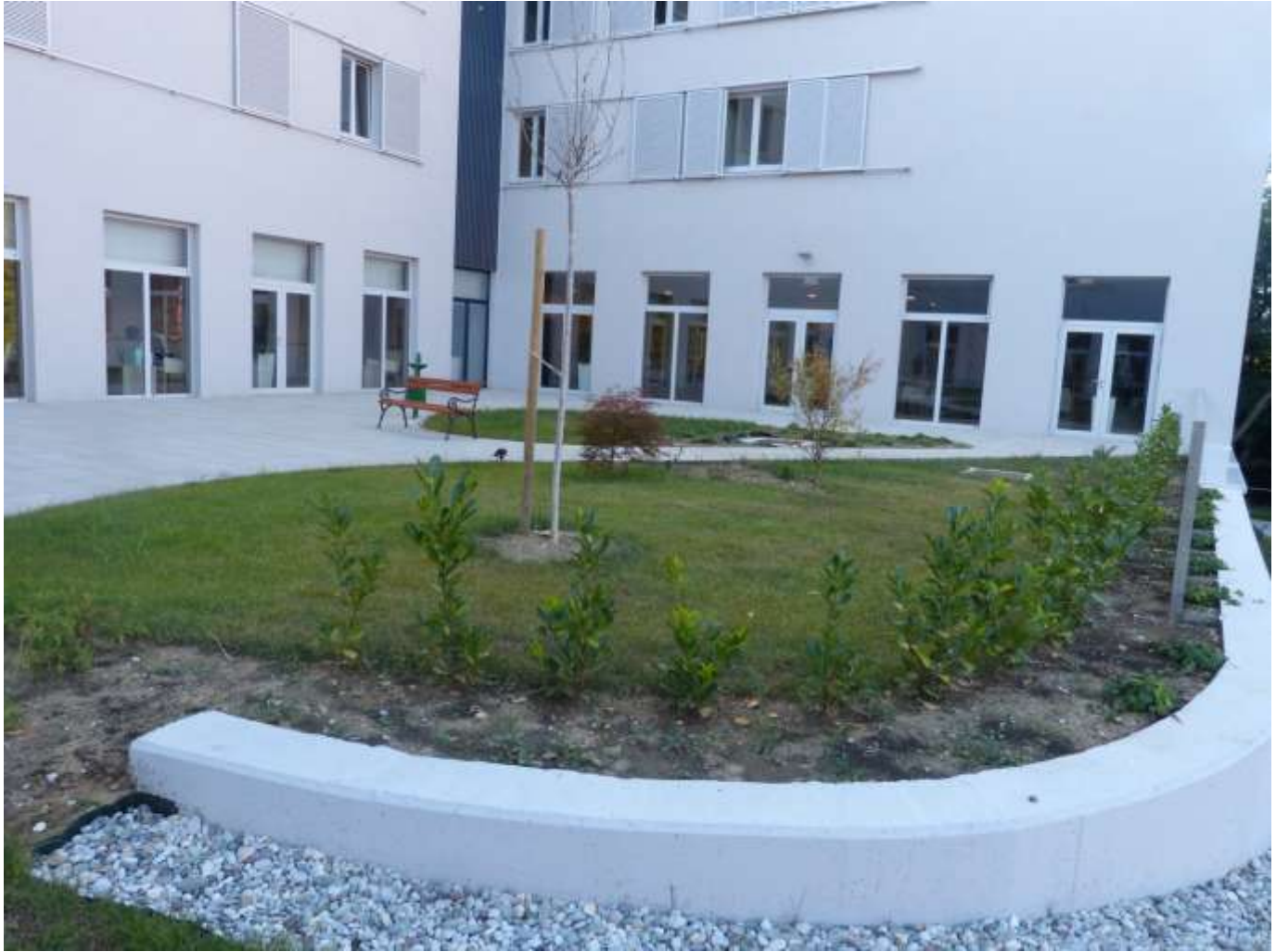
Zgradom okružen park.