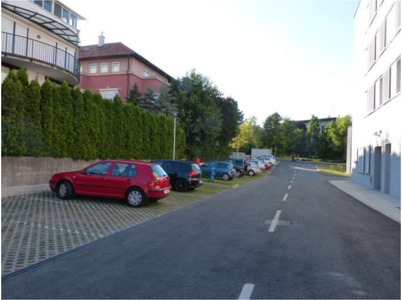
Parkiralište uz dom.