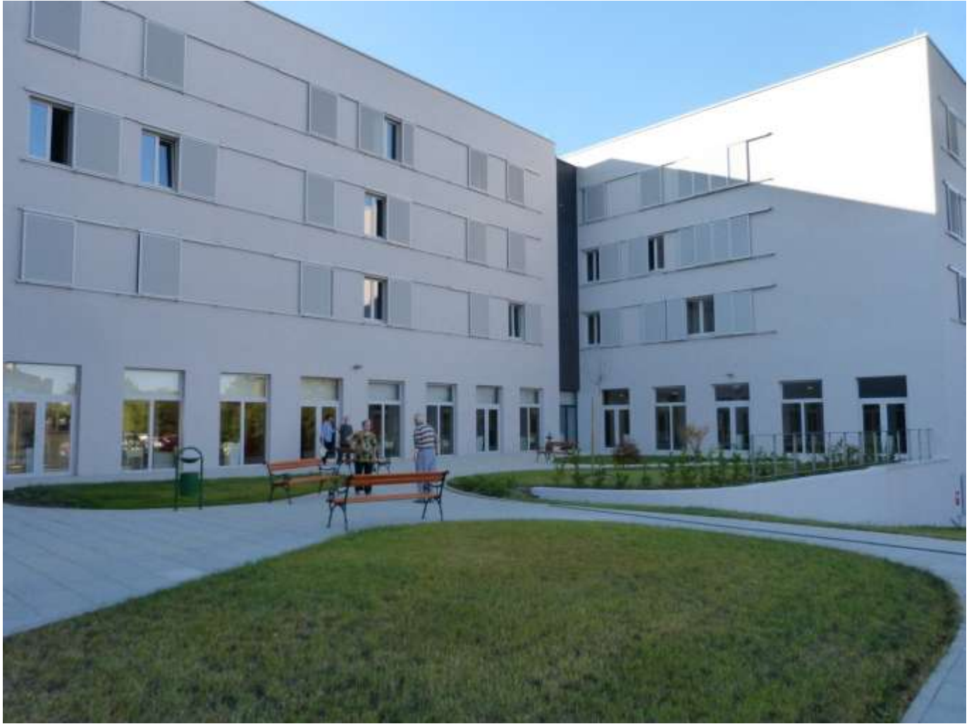
Park okružen zgradom.