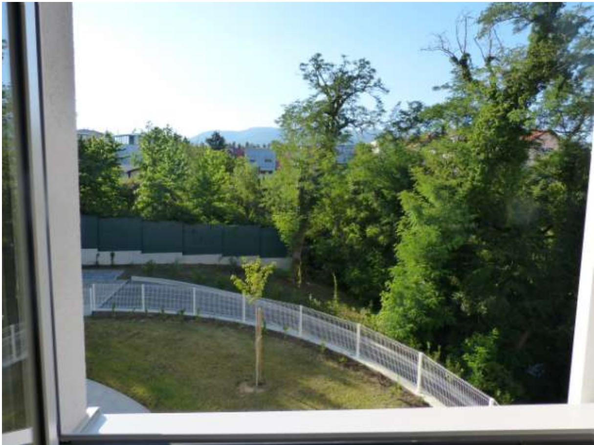
Pogled kroz prozor prema Medvednici