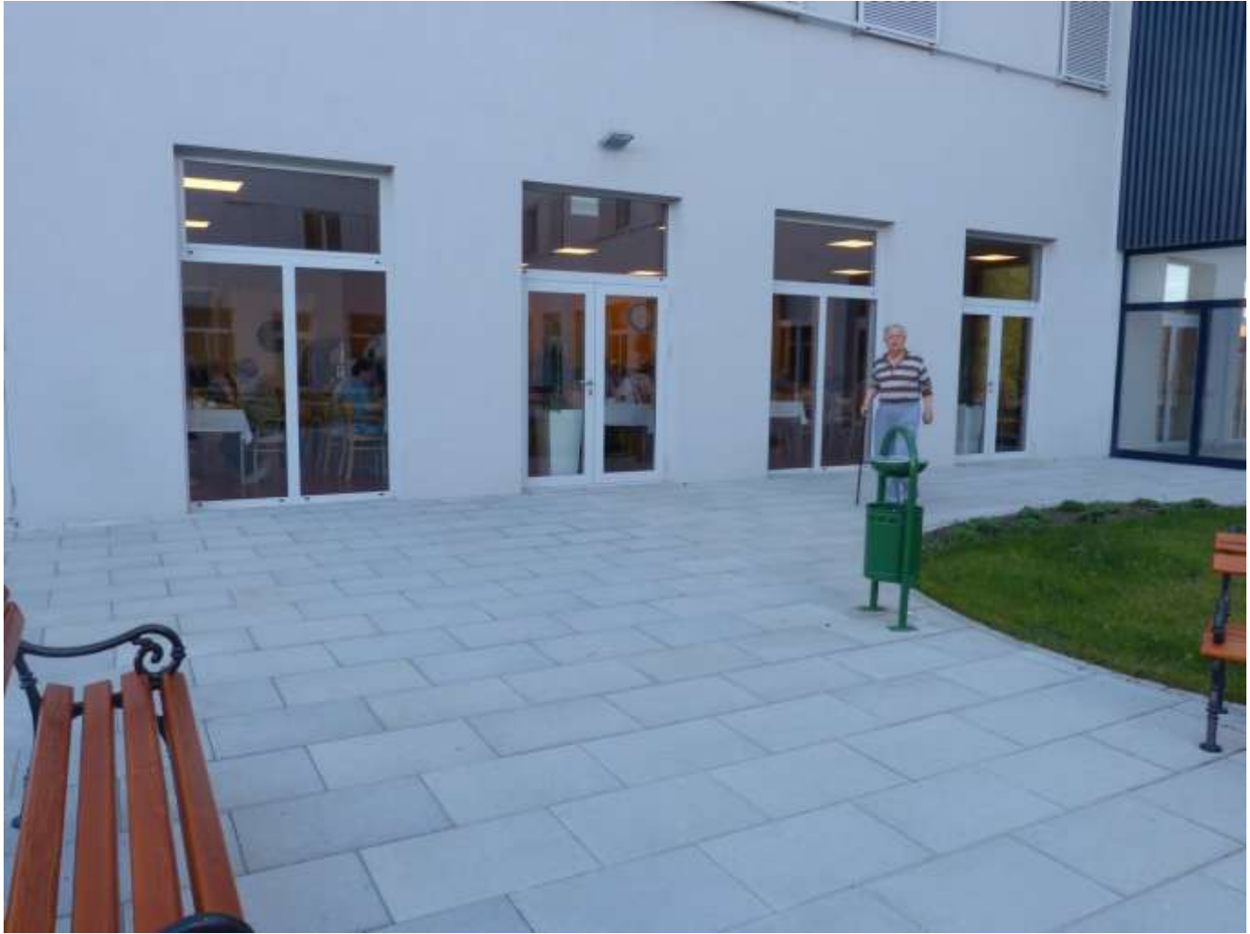
Pogled na blagovaonu iz parka.