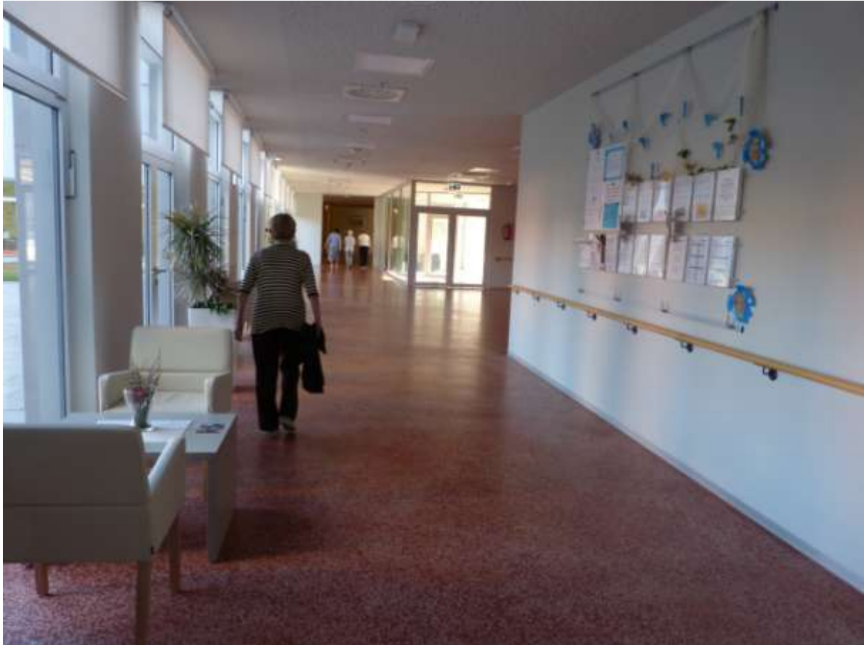
Široki i svijetli hodnici