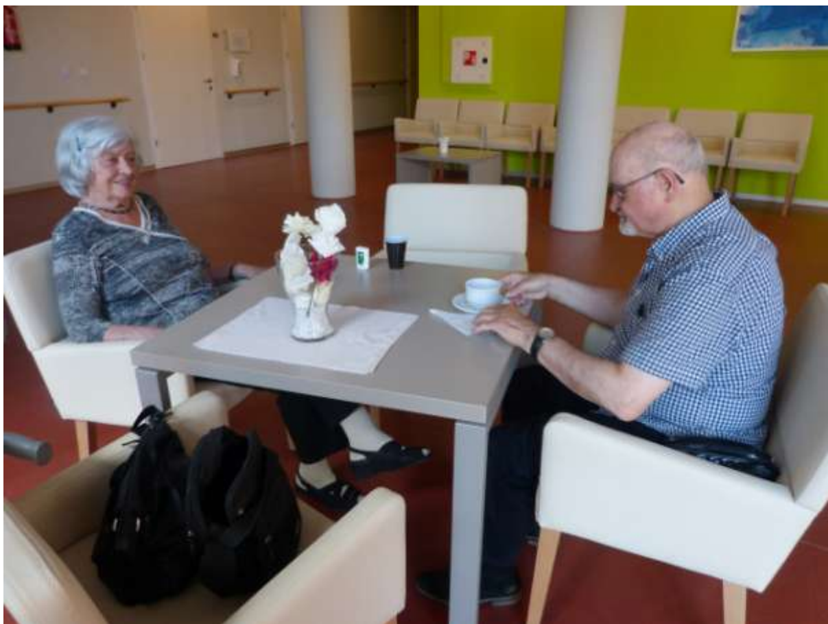
Dnevni je boravak lijep kao i ostale prostorije u domu.